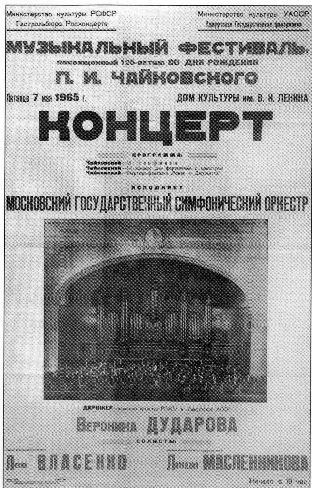
Афиша фестиваля. 1965 г.

Праздник музыки П.И. Чайковского // Ленинский путь. — Воткинск, 1958. — 9 мая. — С. 1.