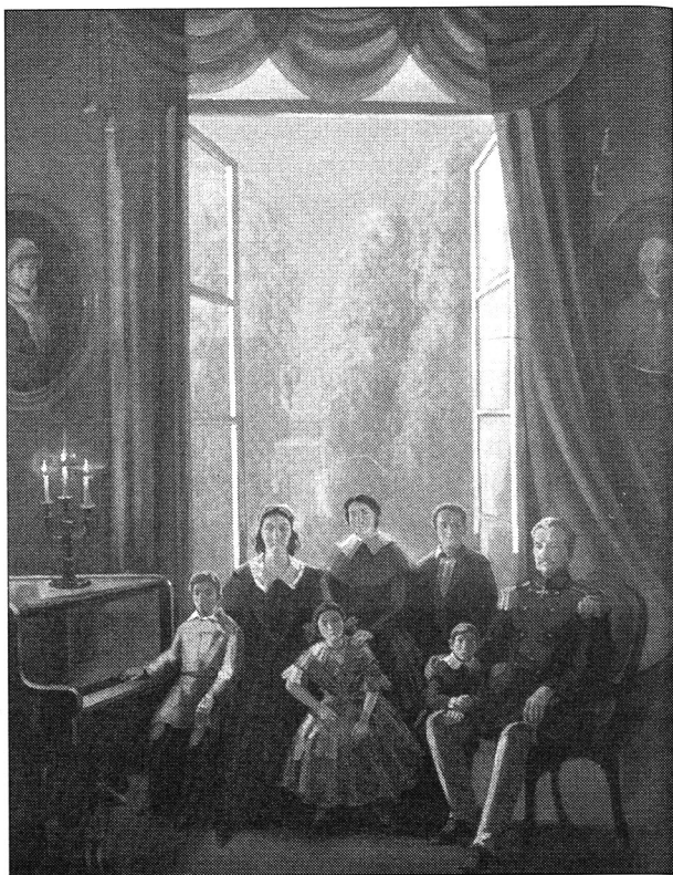
Семья Чайковских. Художник В.Л. Белых

Николай (1838–1910) окончил Горный институт, но как инженер проявил себя в